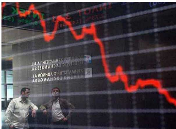
A la izquierda, el desplome de la bolsa de Atenas. A la derecha, una carta del abogado del barón Krupp que revela beneficios de «12 billones».