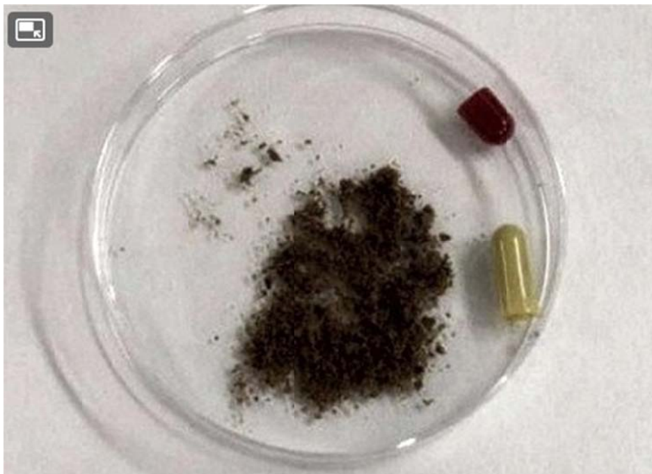
Foto de partes de bebés humanos en cápsulas chinas.